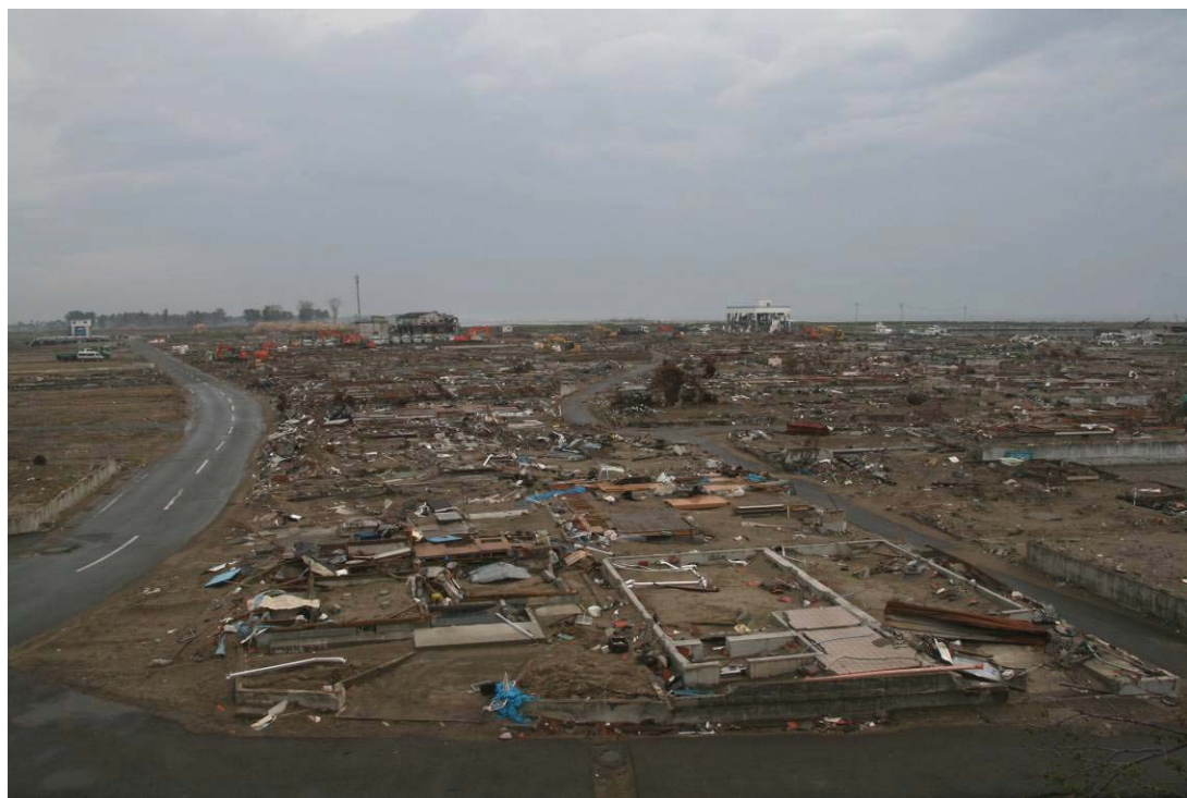
港町の綺麗な町並みはあとかたも無くなった

朝市で有名な名取市関上（ゆりあげ）地区、町は津波により壊滅的な打撃を受けました。復興のためには、是非とも朝市会場に足を運んでみて下さい。 臨時の会場は、名取イオンショッピングモール「エアリ店」にて、日曜・祝日朝6時～10時です。