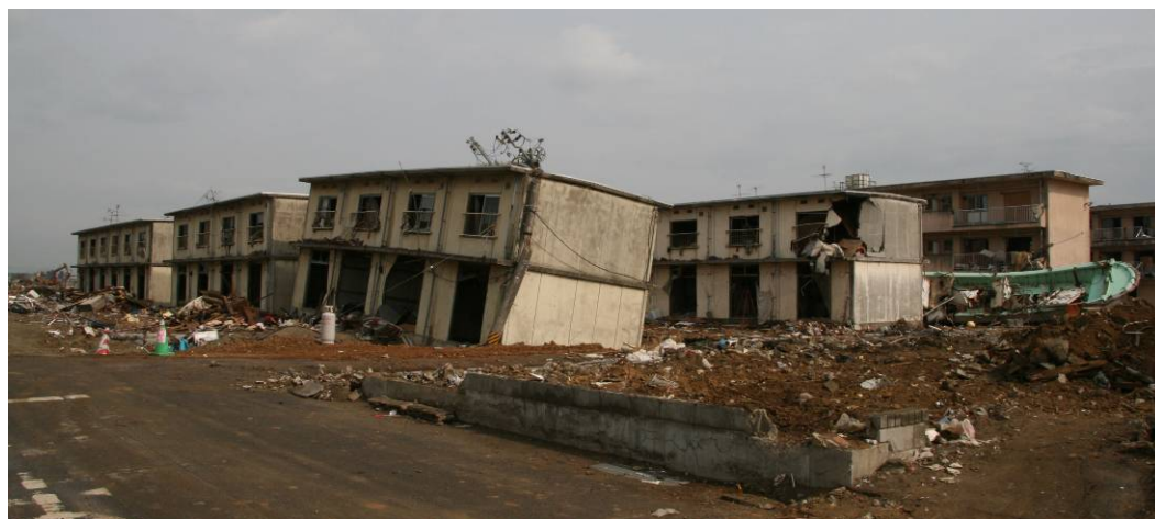
アパートの2階を超えて津波が押し寄せた