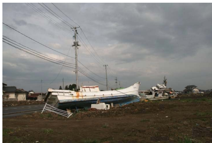
漁船は数キロ先まで流されていた